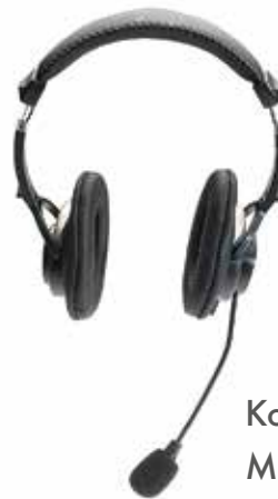
Kopfhörer mit Mikrofon